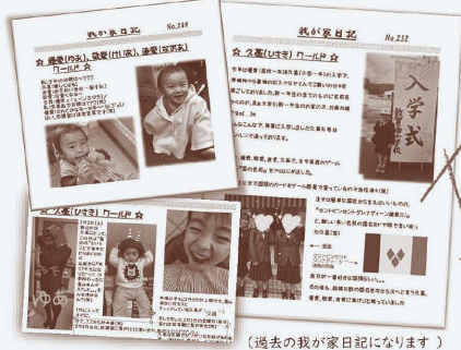
(過去の我が家日記になります)

子供たちのちょっとした日常生活を書いていきます。子供ながらのクスッと笑ってしまうような何気ない出来事をお届けしたいと思っております。