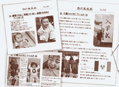
(過去の我が家日記になります)

子供たちのちょっとした日常生活を書いていきます。 子供ながらのグスマッと笑ってしまうような何気ない出来事をお届けしたいと思っております。