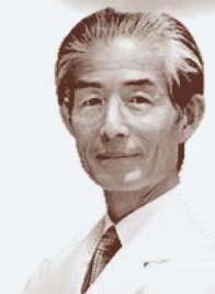
九州大学名誉教授 藤野武彦先生