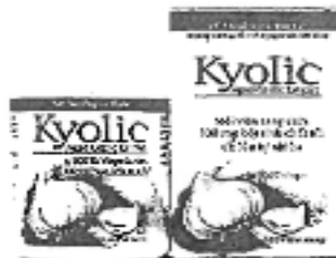
主力製品の海外販売を拡大する

大企業中堅の湧水製菓は年内に もインドで主力の滋養強壮剤「キ ョーレオピン」を発売する。イン ドは法整備が進んでおり、経済成 長を背景に中間・富裕層が増加し ているため、健康関連製品の需要 が著しく増大した。湧水製菓は キョーレオピンの海外展開を推し 進め、新興国市場に参入して海 外事業の拡大を急ぐ。