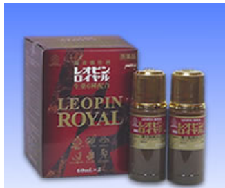
最高のレオピン 「レオピンロイヤル」

人間には本来、どんなウイルスにも対応して 治そうとする免疫力・自然治癒力があるからです。