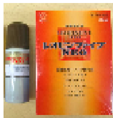
精神力UPのレオピン 継続しやすいレオピン 「ファイブネオ」 「レオピンネオ」